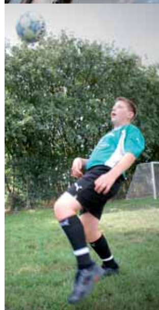
Af Dorde Køhler, journalist

Fodboldklubben B 73 og Fritidsklubben Marievang i Slagelse har indledt et usædvanligt samarbejde. Psykisk handicappede børn og unge optages som fuldgældende medlemmer af fodboldklubben og benytter i forlængelse af træningen fritidsklubbens aftenklub. Til glæde og gavn for alle.