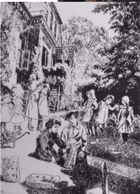
Fru Hedevig Baggers børnehave - Før og nu

I anledning af dagen, havde børnehaven komponeret en sang om Hedevig Bagger som gik på melodien Mariehønen Evigglad, som gengives her: