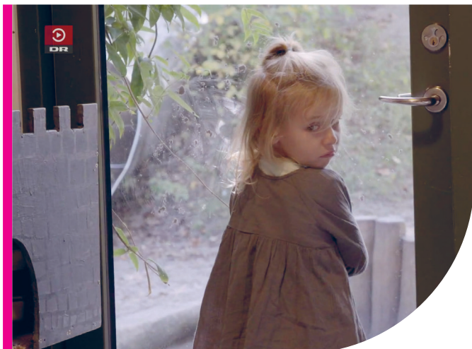
Fra DR-dokumentaren 'Hvem passer vores børn?'

Nu er det endt med en udsendelse, der som den første af tre dokumentarer sætter fokus på de store velfærdsområder som optakt til den forestående valgkamp: daginstitutioner, sygehuse og ældreplejen.