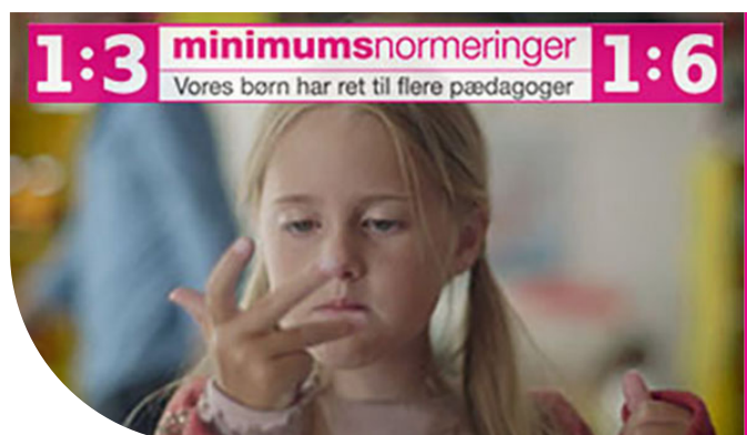
Fra filmen 'Isabella tæller børn'.

Det bliver også startskuddet til en ny systematisk påvirkningsstrategi. Professions- og forskningsargumenterne var på plads, og det samme var dokumentationen for, at der var cirka 4000 pædagoger færre i forhold til antallet af børn sammenlignet med niveauet i 2009. Nu handlede det om at styrke netværket med politikerne.