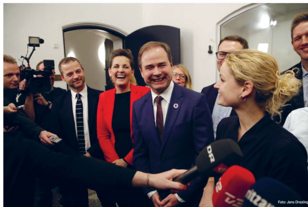
Finansminister Nicolai Wammen (S) fremlægger finansloven for 2020 sammen med regeringens støttepartier.

” Det vigtigste var loven. Nu får vi et værn mod fremtidige besparelser på børnene. Efter mere end 30 års forringelser er det et historisk resultat.